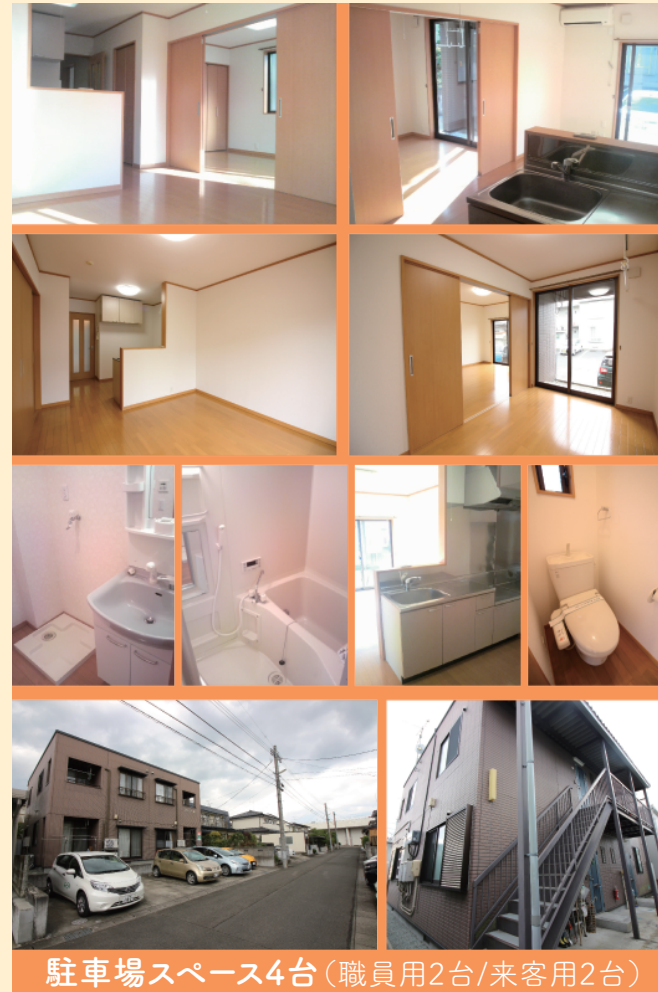
駐車場スペース4台(職員用2台/来客用2台)